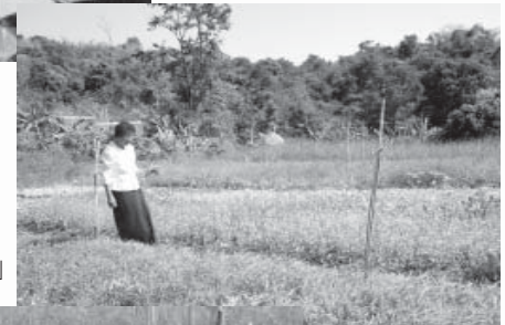
เก็บผักไปดูใจไป