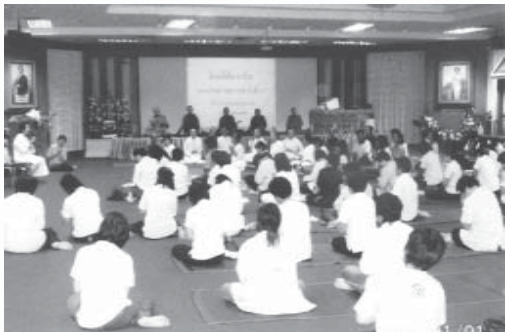
ญาติธรรมให้ความสนใจในเส้นทาง การเข้าถึงธรรมของแม่อ้าว