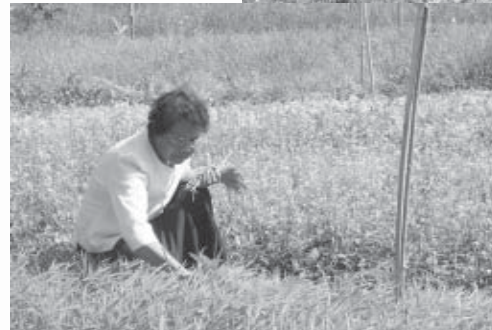
รู้สึกรักตัวทั่วพร้อม