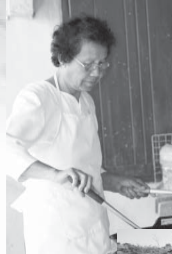
แม่อ้าวทำงานครัว เลี้ยงคนไปปฏิบัติธรรมเสมอ