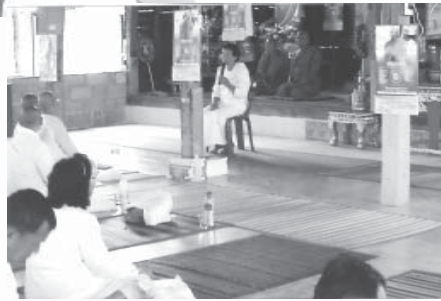
เป็นวิทยากรรับเชิญออกเล่าประสบการณ์ทางธรรม