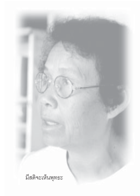
มีสติจะเห็นพุทธะ

หลายเดือนต่อมา เมื่อจิตได้รับการกระทบสัมผัสกับอารมณ์ต่างๆ หลายเรื่องต่อหลายเรื่องเข้ามา เกิดความอยาก ความต้องการเข้ามาแทน ก็เลยลืมความสุขในฝันนั้นไปเลย