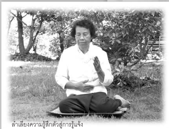
ลำเลียงความรู้สึกรู้สึกตัวสู่การรู้แจ้ง