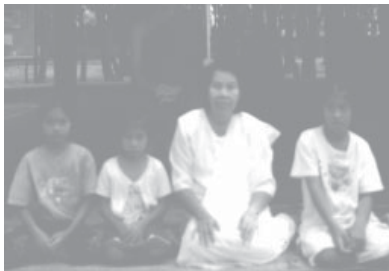
ถ่ายตอนพาหลานๆ ไปปฏิบัติธรรมหลายปีมาแล้ว

จากวันที่ ๑-๓ ก็เดินจงกรมบ้าง นั่งสร้างจังหวะบ้าง สลับกันอยู่ตลอดวัน ตอนเช้าของวันที่ ๓ ในระหว่างข้าพเจ้าเจริญสติอยู่นั้น สติเข้าไปเห็นความคิดของตัวเอง มันเห็นถึงมากจนกระทั่งรู้สึกว่ารำคาญความคิดของตัวเอง ก็เลยถามใจตัวเองว่า