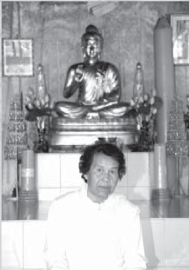
พบพระพุทธเจ้าแบบสมมุติ-ปรมาตม์

“ถ้าสติเป็นพระพุทธเจ้าแล้วเจ้าชายสิทธัตถะเป็นใคร?” อีกคนหนึ่งก็ตอบว่า “เจ้าชายเป็นพระพุทธเจ้าโดยสมมุติ ไม่ใช่พระพุทธเจ้าโดยปรมาตม์”