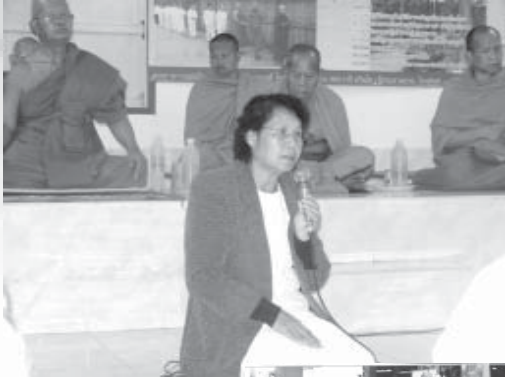
เล่าประสบการณ์ทางธรรม